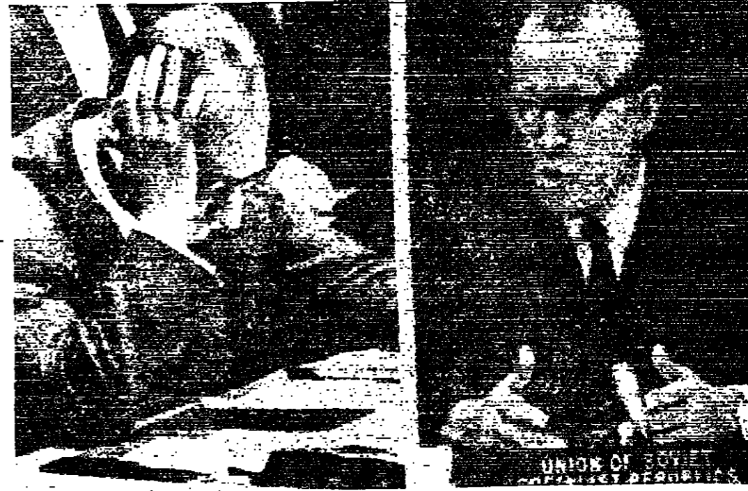
المستر جاكوب مالك مندوب الاتحاد السوفياتي ، والمستر جيري هاجيكوزير خارجية نيكوسولافيا اتقاء مناقشة قضية نيكوسولافيا في مجلس الامن «صورة لاسلكية لليونانديتريس خاصة بالمستور»

وقال التطورات في نيكوسولافيا بظواهرها الطويلة في بولندا خلال شهر يقدم انخر اتواع متقابل تكسي اكسبرسي